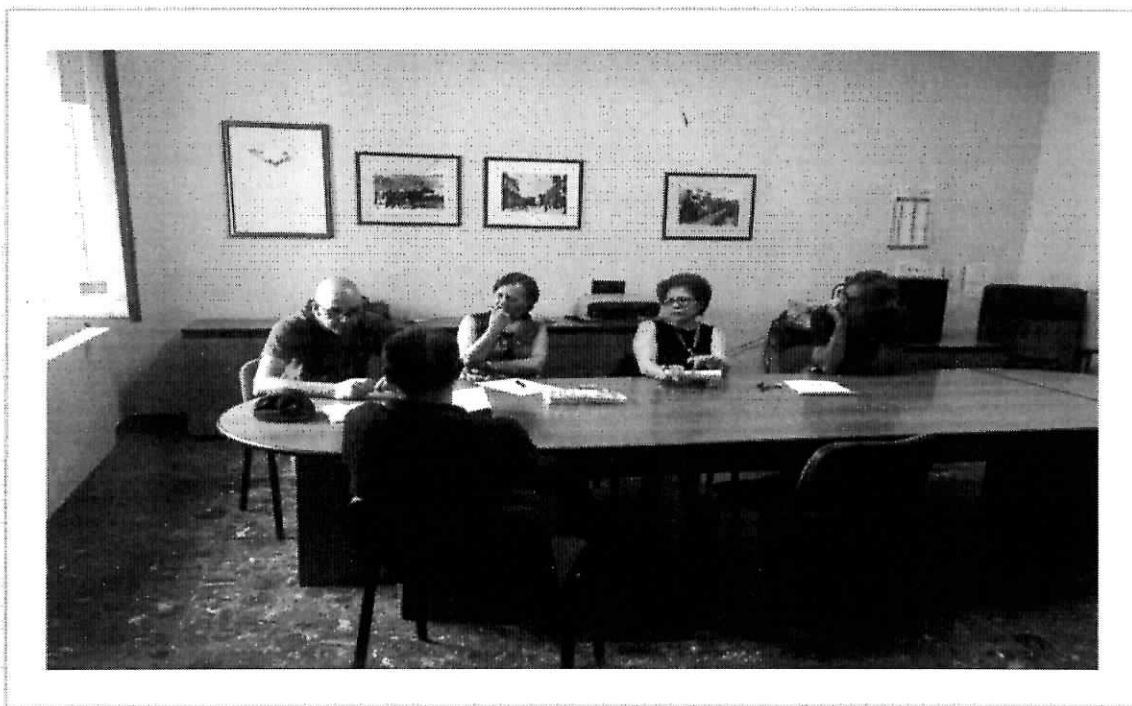
CONCORSO PROGRESSIONI - MOMENTO DEL COLLOQUIO

non ha usufruito di progressioni né orizzontali né verticali cosa che denota sicuramente una poca attenzione della politica verso il personale dipendente.