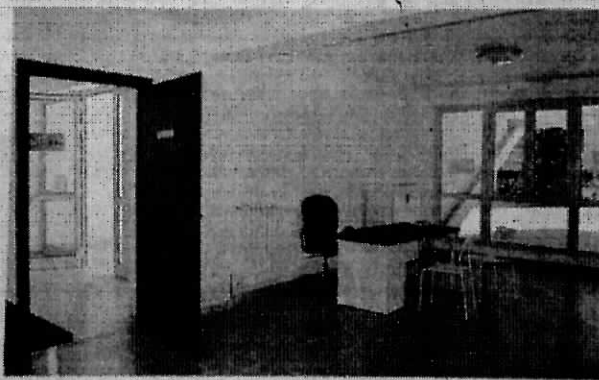
UN'IMMAGINE SIMBOLICA DI UN UFFICIO COMUNALE

In arrivo piani di formazione per i dipendenti a tempo determinato presentati dai comuni di Catenanuova, Agira, Valguarnera, Calascibetta e dell'Asp di Enna. Al riguardo dal consiglio di amministrazione di "Fonservizi" è stata destinata la somma di 8000 euro. L'iniziativa è stata avviata agli inizi di quest'anno dopo l'adesione degli enti al fondo paritetico interprofessionale per la formazione continua "Fonservizi" e partecipando al bando 01/2016. I quattro Comuni e l'Asp di Enna, grazie al sostegno del Centro studi enti locali avevano presentato in progetto formativo, contenente un programma organico di azioni mirate all'aggiornamento e alla qualificazione