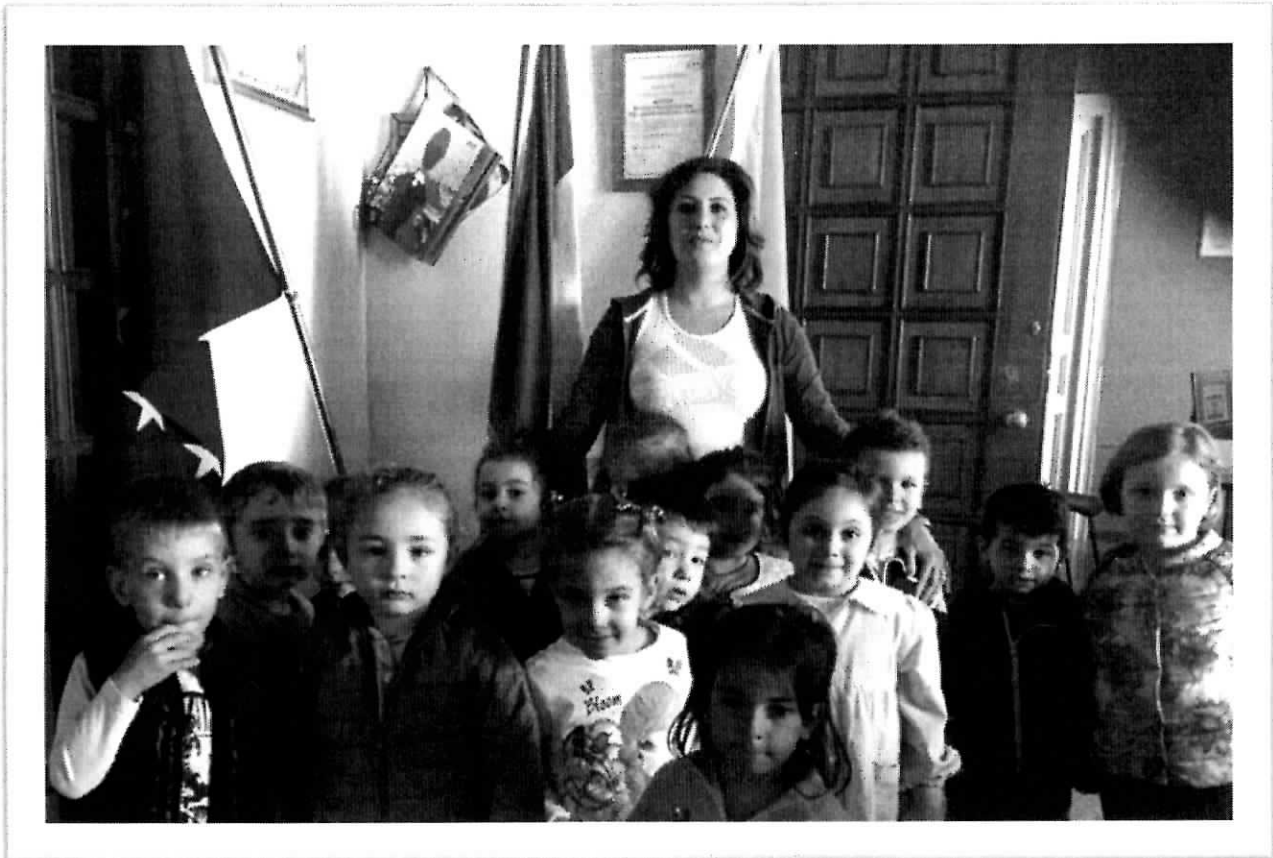
IL SINDACO ACCOGLIE I BAMBINI DELL'INFANZIA