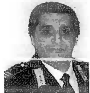
Militare in servizio