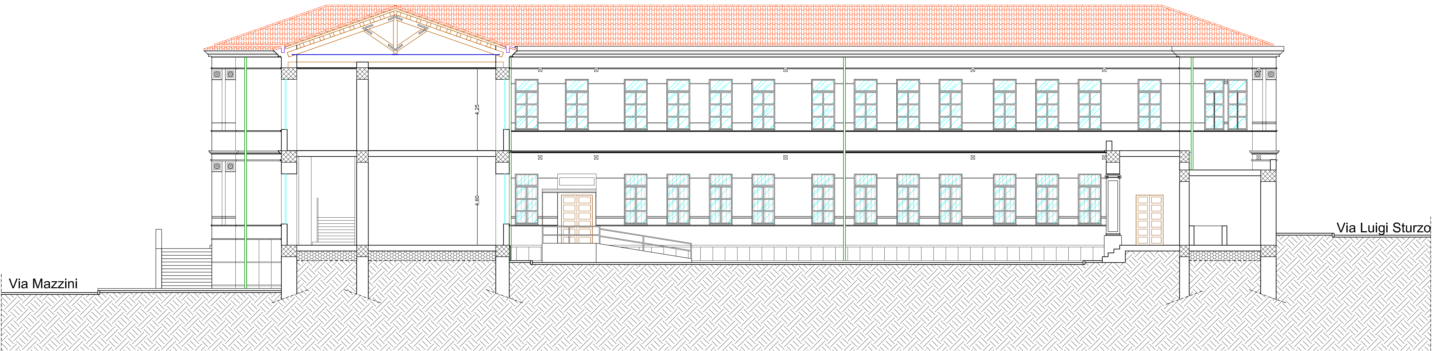
SEZIONE C-C SCALA 1:100