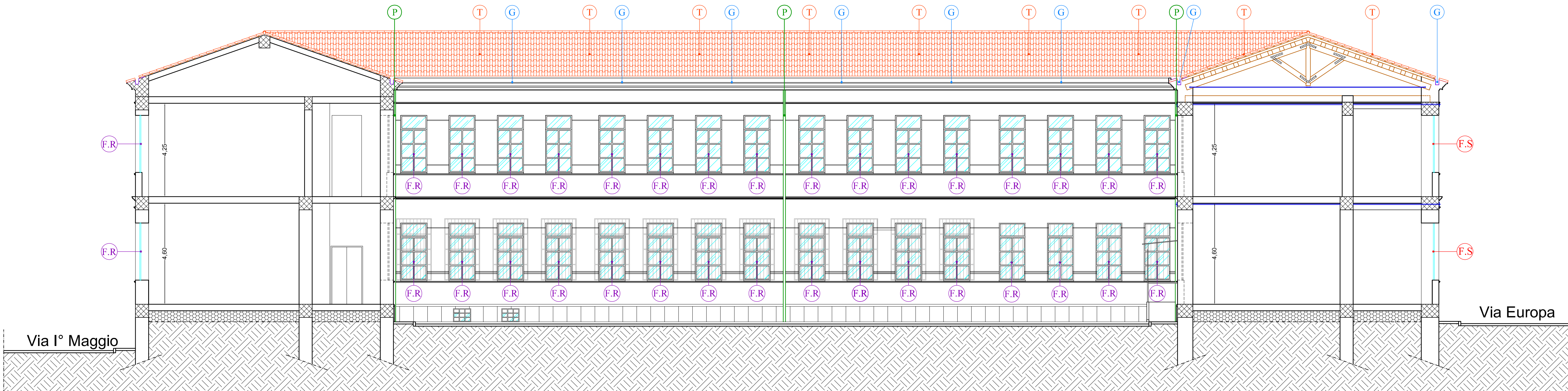
SEZIONE A-A SCALE 1:100