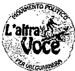
GRUPPO CONSILIARE L'ALTRA VOCE PER VALGURNERA