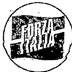
GRUPPO CONSILIARE FORZA ITALIA

Al Presidente del Consiglio Comunale Al Sindaco Comune di Valguarnera Caropepe