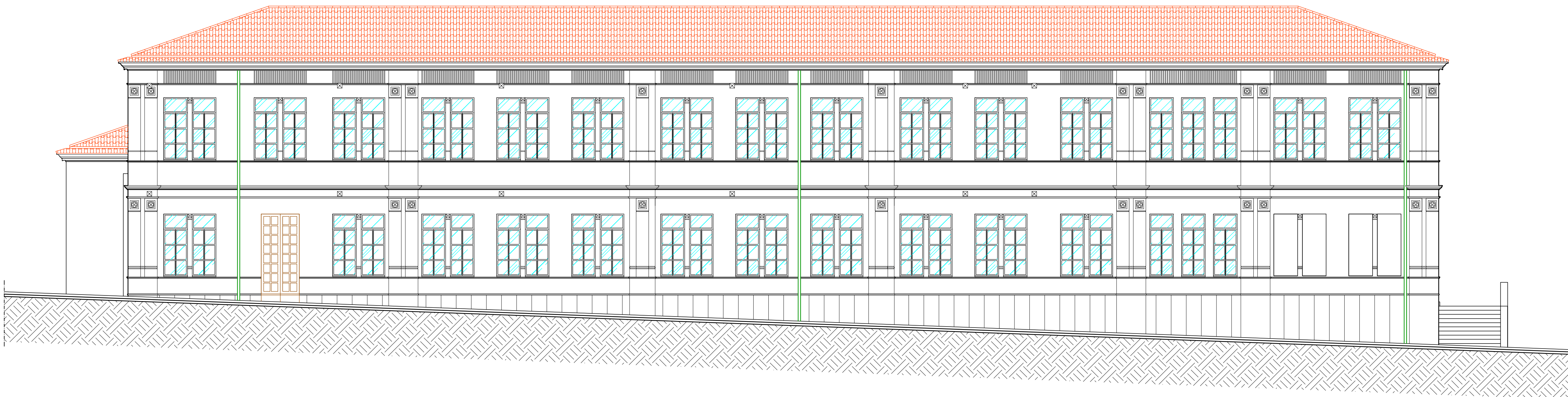
PROSPETTO SU VIA EUROPA SCALA 1:100