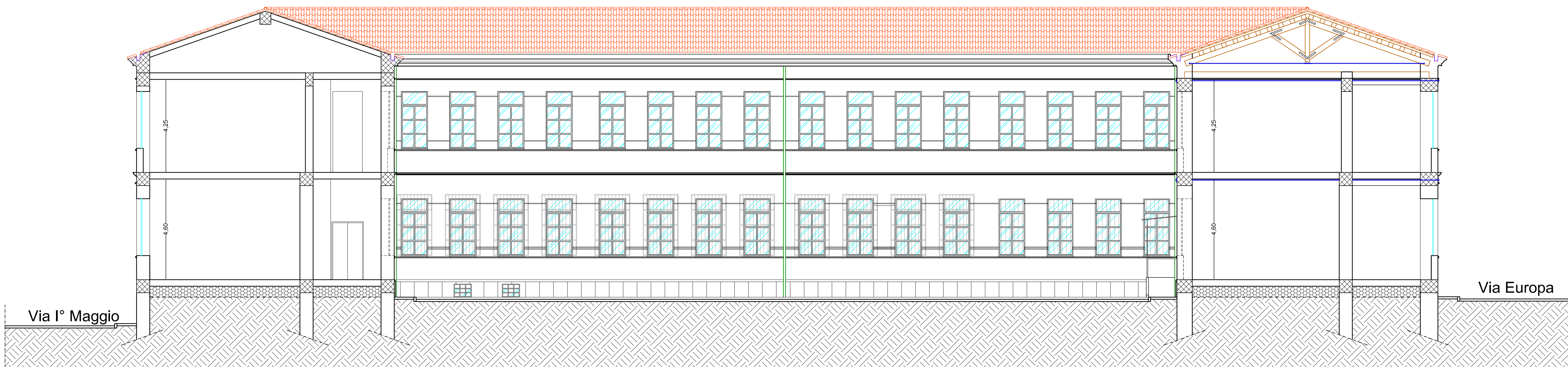
SEZIONE A-A SCALA 1:100